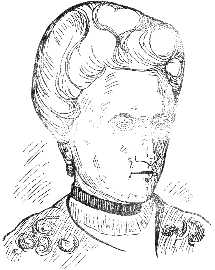
गोज़ा लुक्जे म्बु री